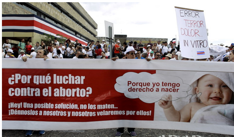
Una protesta en contra del aborto, Costa Rica, 2015.

El caso ejemplifica muchas contradicciones en la situación de las mujeres en este país centroamericano. Por un lado, Costa Rica tiene una mortalidad materna muy baja , ha firmado y ratificado casi la mayoría de instrumentos internacionales de Derechos Humanos, los cuales además por jurisprudencia constitucional son superiores a su misma constitución y desde 1948 no tiene ejército sino inversión en salud y educación .