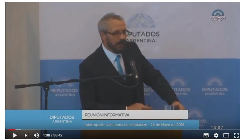
Exposición de Leonel Briozzo en Diputados - 24/05/2018