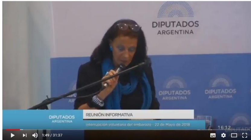
Exposición de Raffaella Schiavon en Diputados - 22/05/2018